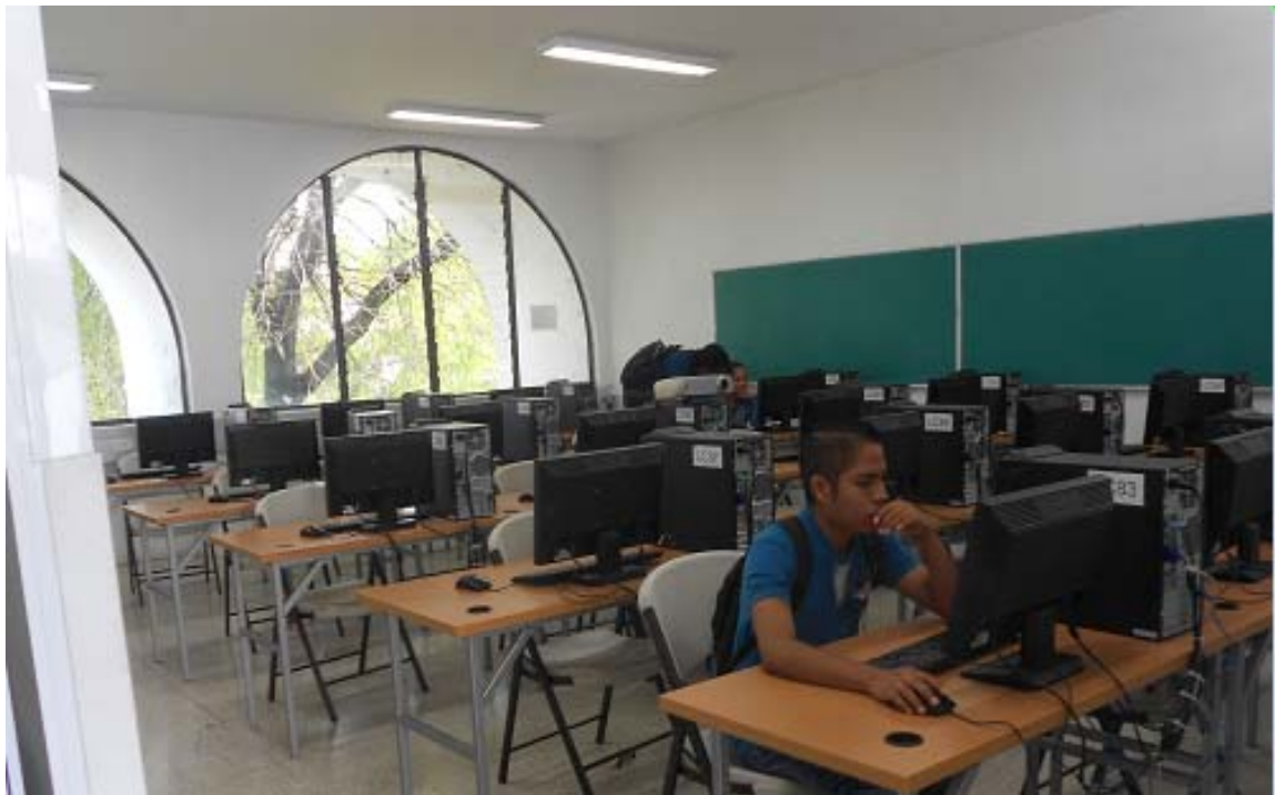
LABORATORIOS DE COMPUTACIÓN, EDIFICIO B